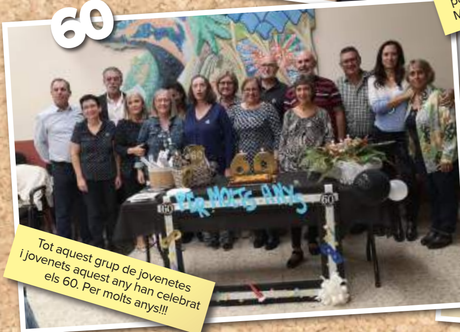
Tot aquest grup de jovenetes i jovenets aquest any han celebrat els 60. Per molts anys!!!