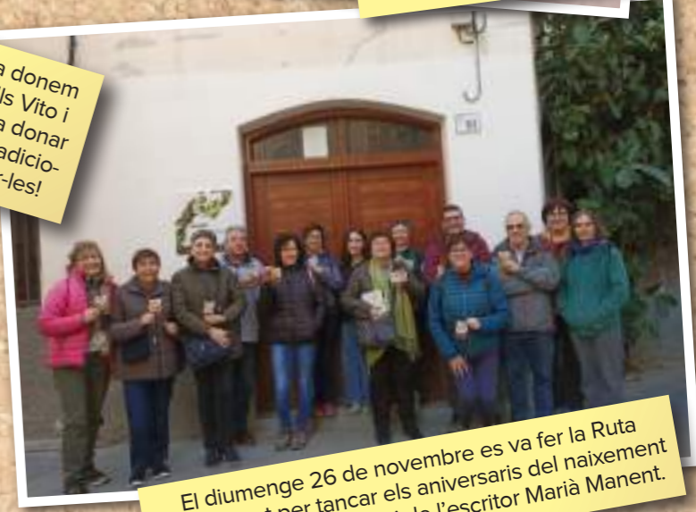
El diumenge 26 de novembre es va fer la Ruta Mir-Manent per tancar els aniversaris del naixement del pintor Joaquim Mir i de l'escriptor Marià Manent.