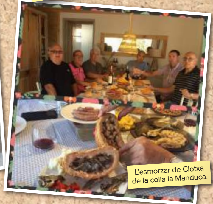
L'esmorzar de Clotxa de la colla la Manduca.