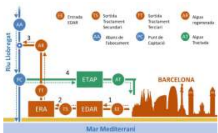
Esquema de reaprofitament en el curs baix del riu Llobregat (ACA. Gencat).

També tenim el cas de l'ERA del Prat de Llobregat (fig. 1), que, obtinguda l'aigua regenerada, es torna al riu aigües amunt i, diluïda pel propi riu, és captada de nou uns km més avall. És potabilitzada i entra de nou al consum domèstic, sempre d'acord amb els estàndards de qualitat estatal i europea (reglament EU 2020/741), i les recomanacions de seguretat de l'Organització Mundial de la Salut. Segons el Pla de Sequera, la reutilització d'aigües està prevista en el sistema Ter-Llobregat només en el cas actual de sequera extrema.