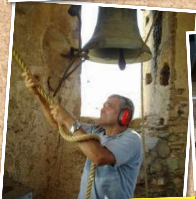
Des de la revista, volem recordar el Josep Rabascall en el 5è aniversari de la seva mort, el dia 22 d'agost de 2019. No ens oblidem de la seva persona, ni de la seva tasca incansable per aquesta publicació i per al poble.