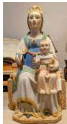
Mare de Déu del Patrocini, s. XV, provinent de l'antiga parroquia de la Mussara.

Per entrar a les entranyes de l'exposició i entendre per què s'ha fet i com ha estat concebuda, n'hem parlat amb un dels organitzadors.