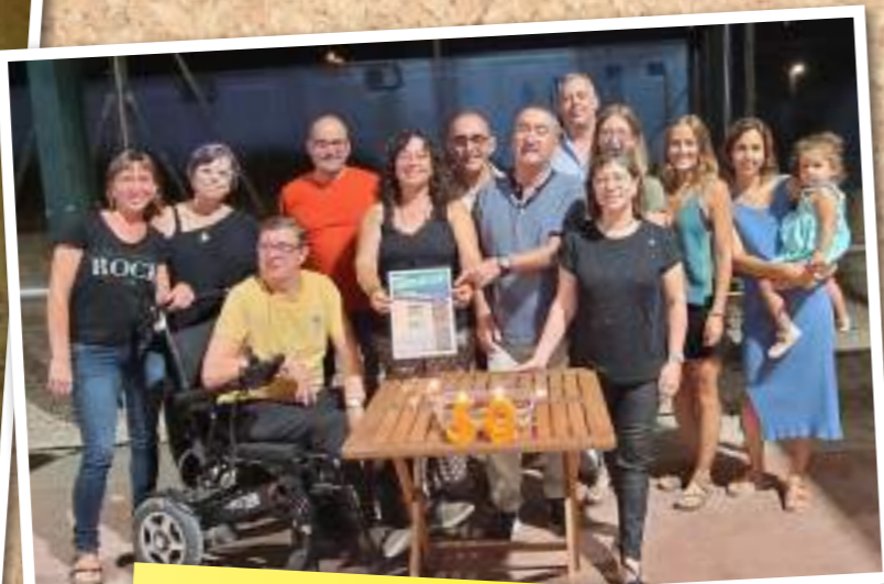
Des de l'equip de redacció de la revista celebrem que hem arribat als 50 números de Maspujols.cat. Agraïm a totes les persones que número rere número la fan possible, redactors i col·laboradors, i a tots els nostres lectors i lectores que l'esperen puntualment a les seves bústies.