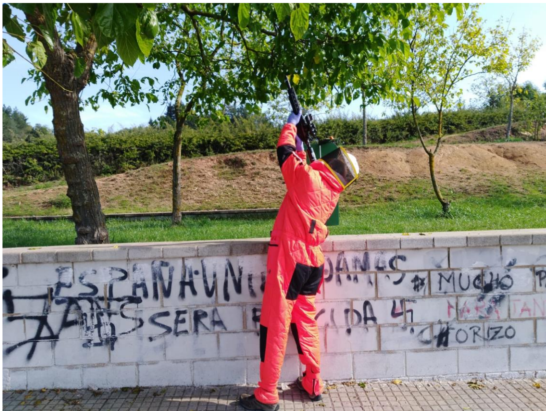
Tècnic d'una empresa de control de plagues inactivant un vesper amb els EPI corresponents